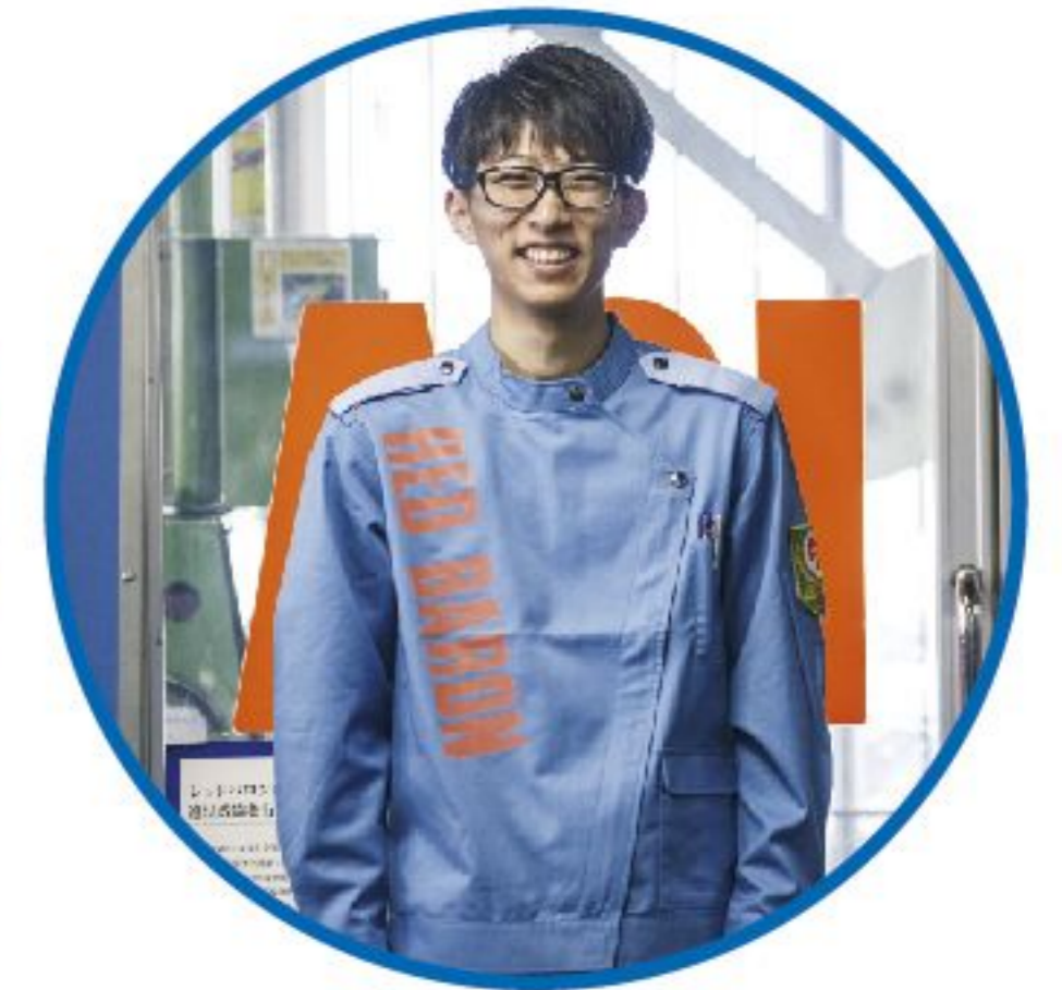
整備職 未経験者歓迎