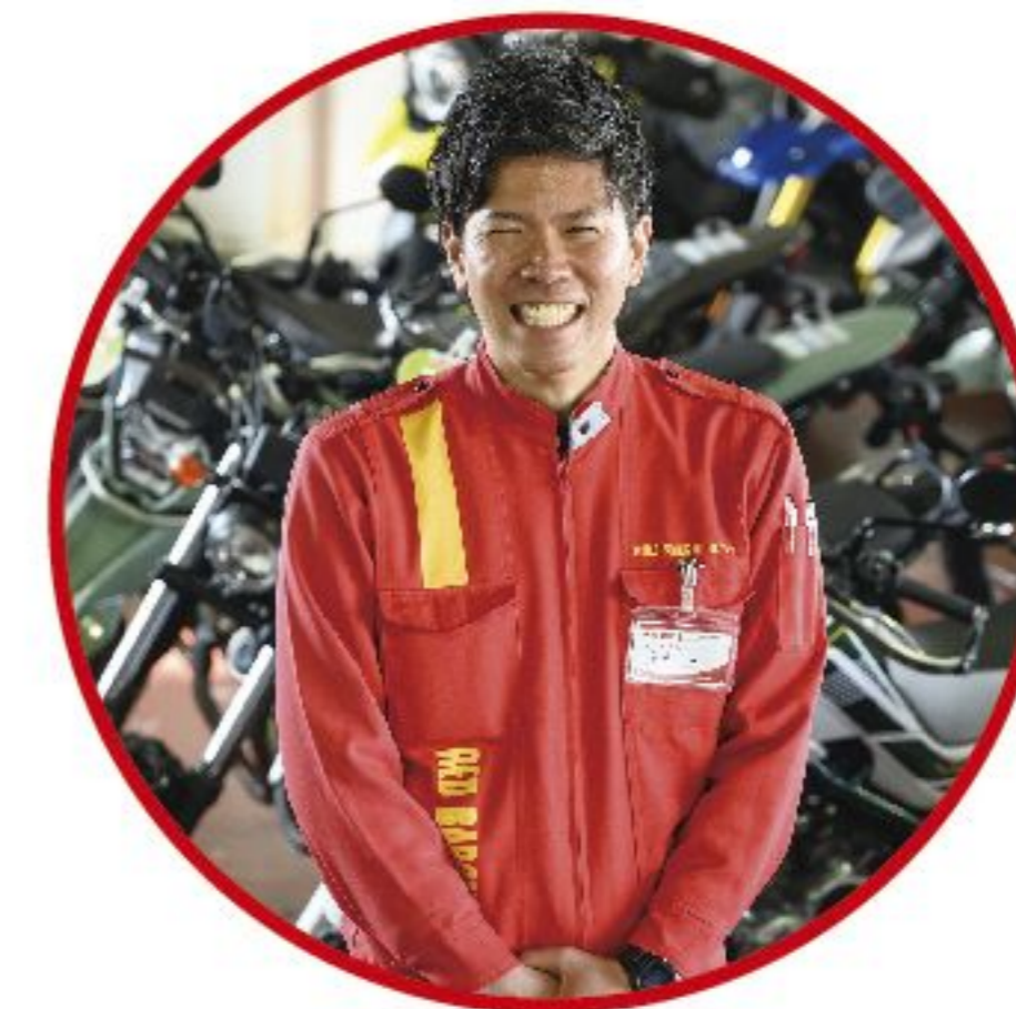
営業職 販売買取スタッフ