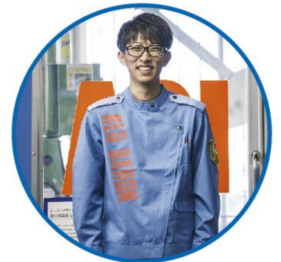
整備職 未経験者歓迎