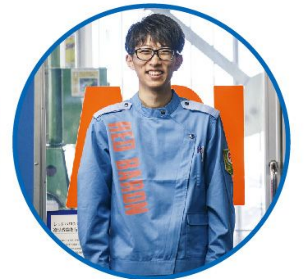
整備職 未経験者歓迎