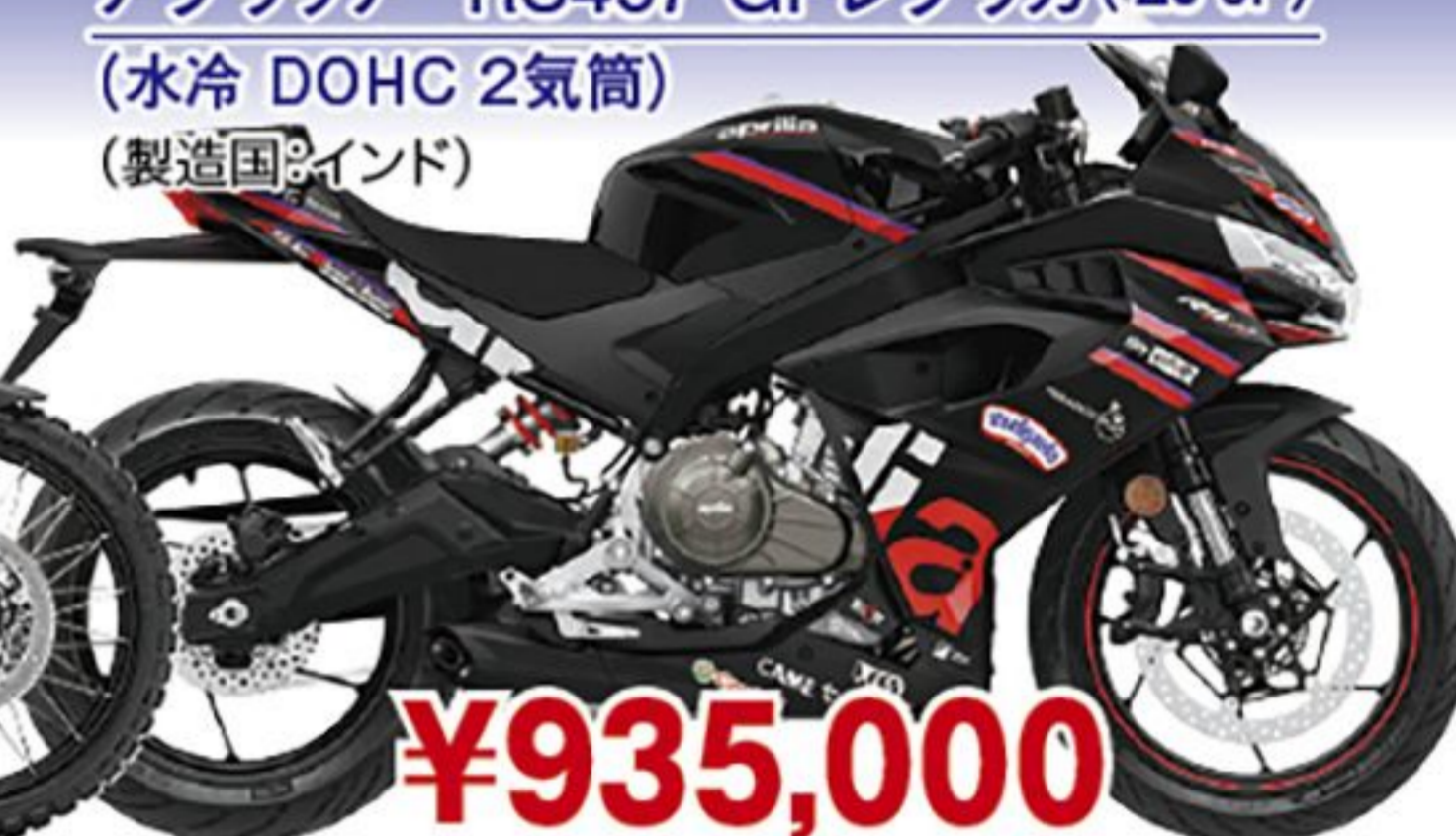
アプリア RS457 GPレプリカ('26 JP) (水冷 DOHC 2気筒) (製造国:インド)