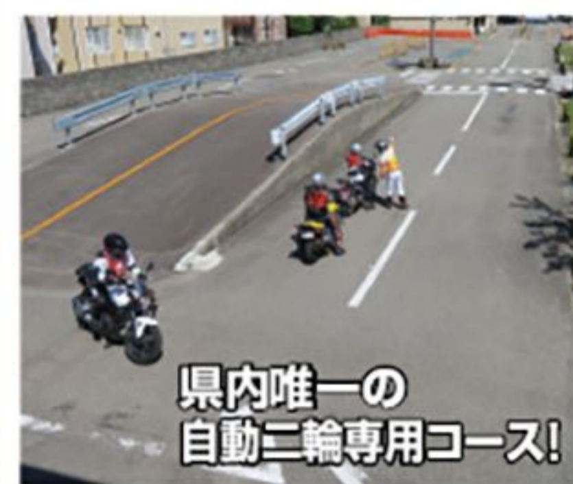
県内唯一の 自動二輪専用コース!