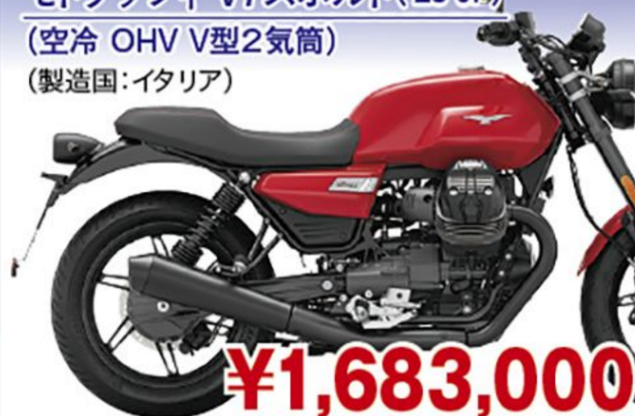
モトグッツィ V7スポーツ('26 JP) (空冷 OHV V型2気筒) (製造国:イタリア)