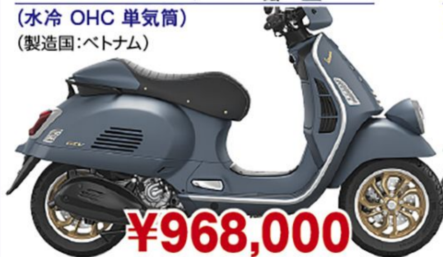
ベスパ GTV300 オフィーナ オット('25 JP) (水冷 OHC 単気筒) (製造国:ベトナム)