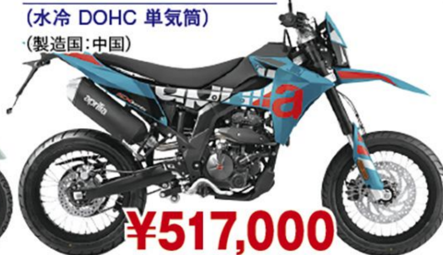
アプリア SX125('26 JP) (水冷 DOHC 単気筒) (製造国:中国)