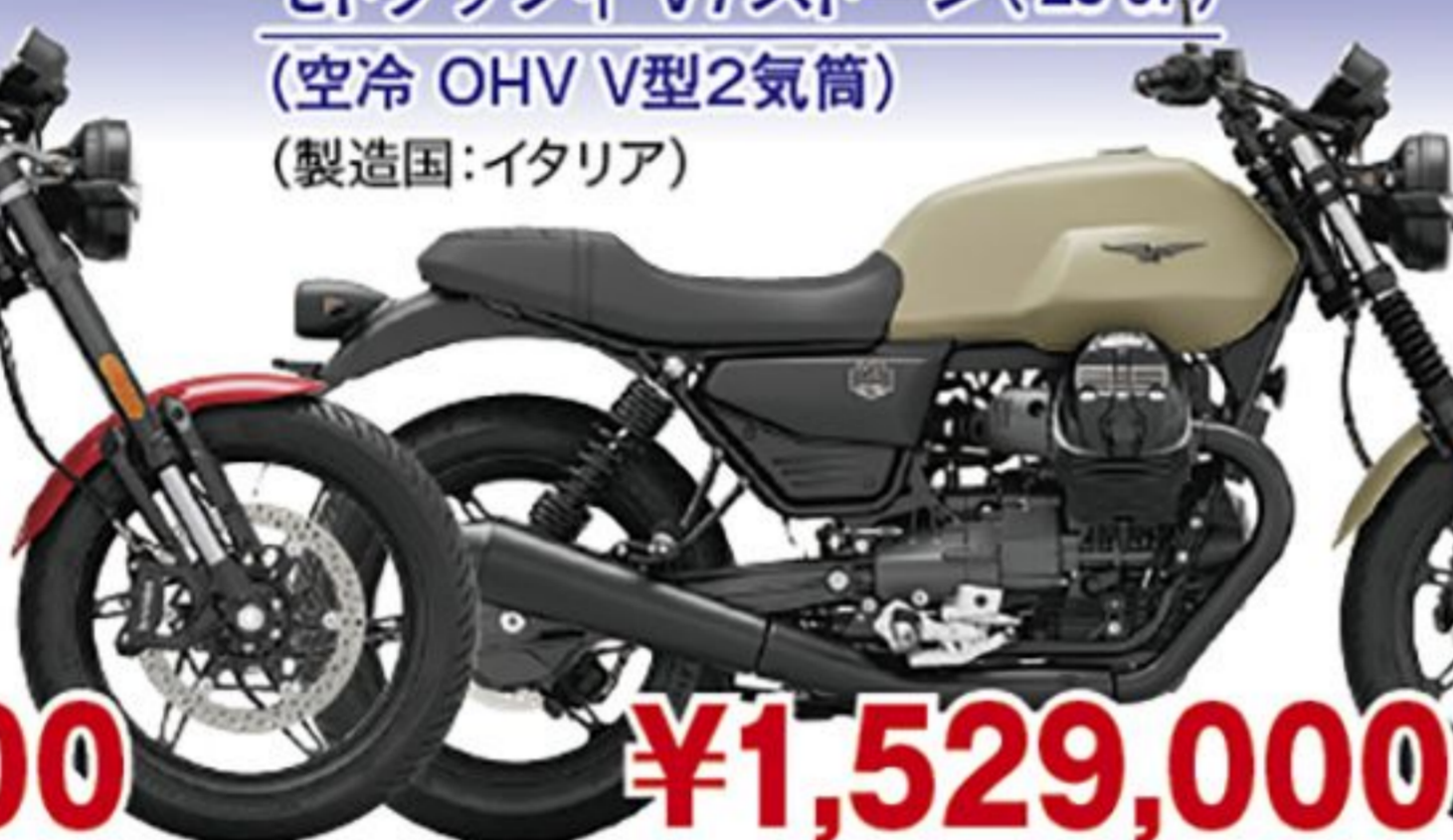
モトグッツィ V7ストーン('26 JP) (空冷 OHV V型2気筒) (製造国:イタリア)