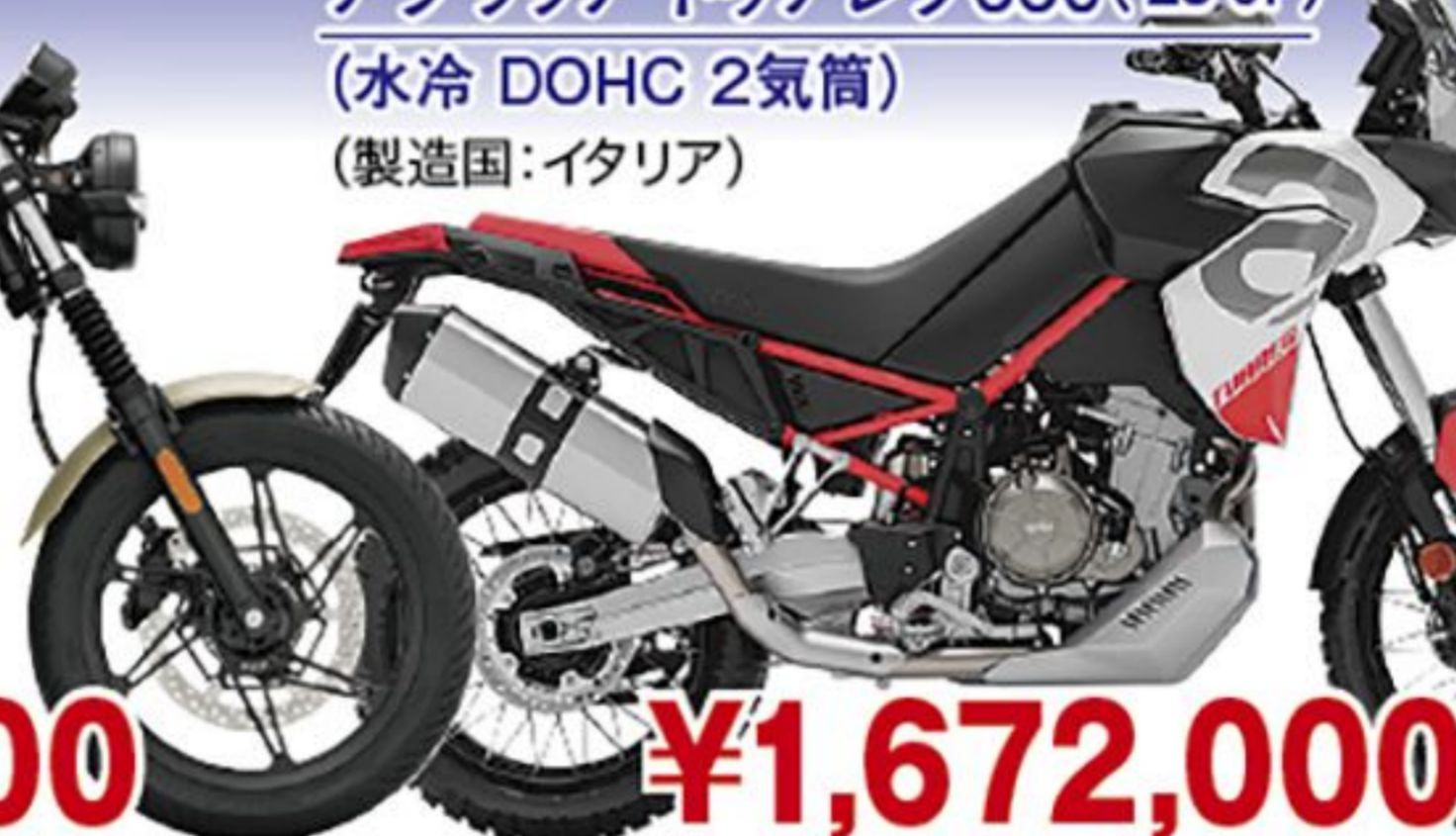
アプリア トゥアレグ660('25 JP) (水冷 DOHC 2気筒) (製造国:イタリア)