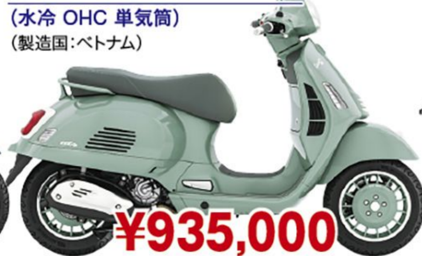
ベスパ GTS300 80th('26 JP) (水冷 OHC 単気筒) (製造国:ベトナム)