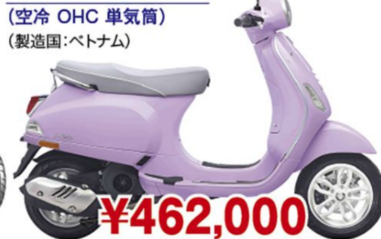
ベスパ LX125('25 JP) (空冷 OHC 単気筒) (製造国:ベトナム)