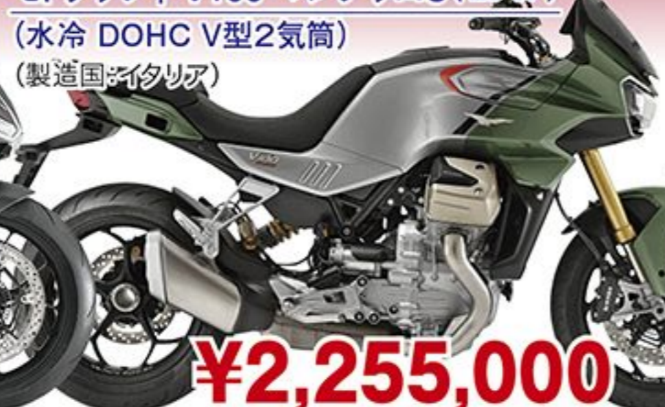
モトグッツィ V100 マンデッロS('23 JP) (水冷 DOHC V型2気筒) (製造国:イタリア)