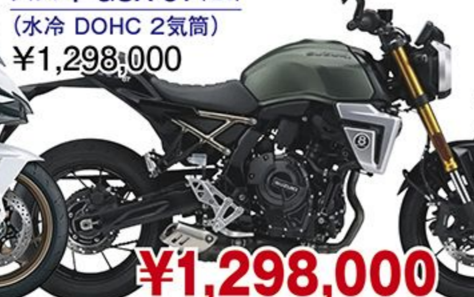
スズキ GSX-8T('26) (水冷 DOHC 2気筒) ¥1,298,000