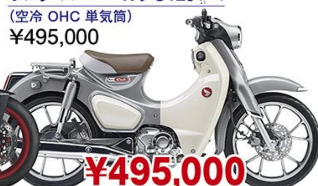
ホンダ スーパーカブC125('26) (空冷 OHC 単気筒) ¥495,000