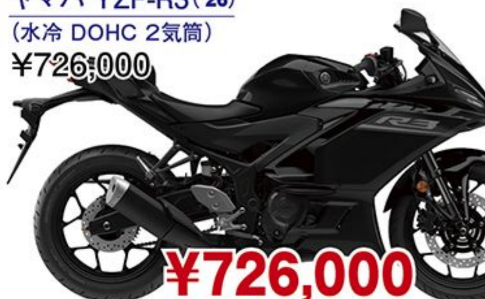
ヤマハ YZF-R3('26) (水冷 DOHC 2気筒) ¥726,000