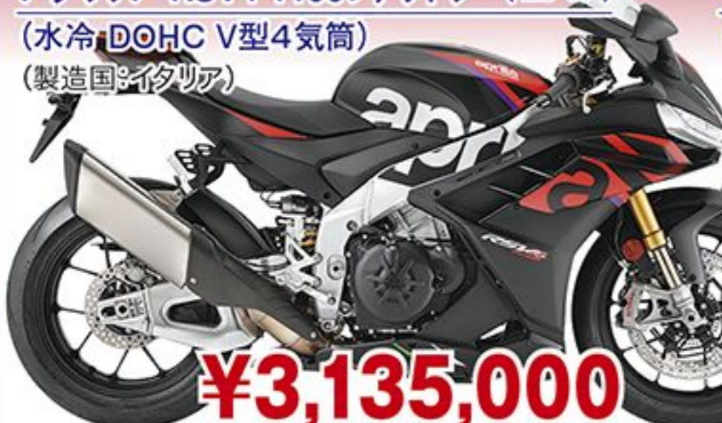
アプリリア RSV4 1100ファクトリー('23 JP) (水冷 DOHC V型4気筒) (製造国:イタリア)