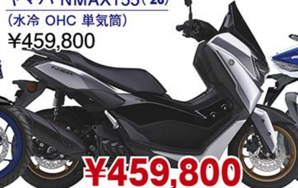
ヤマハ NMAX155('26) (水冷 OHC 単気筒) ¥459,800