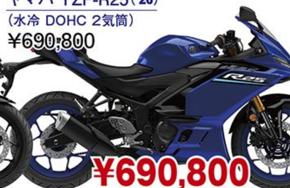
ヤマハ YZF-R25('26) (水冷 DOHC 2気筒) ¥690,800