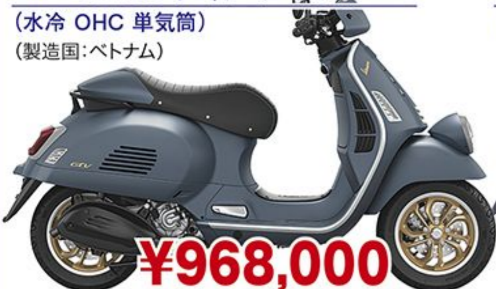
ベスパ GTV300 オフィチーナ オット('25 JP) (水冷 OHC 単気筒) (製造国:ベトナム)