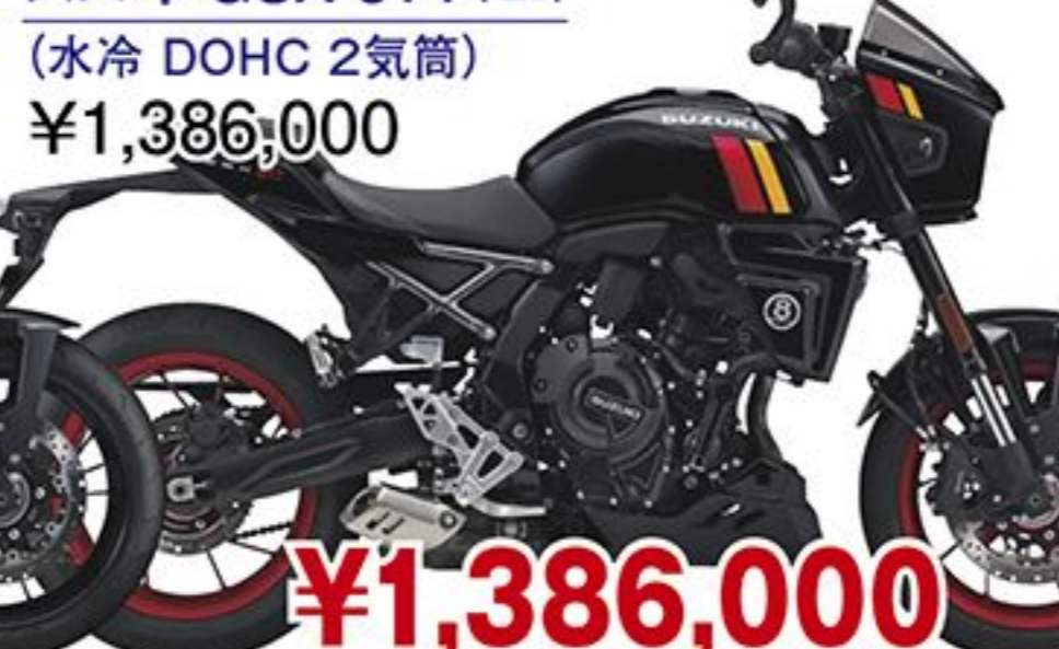
スズキ GSX-8TT('26) (水冷 DOHC 2気筒) ¥1,386,000