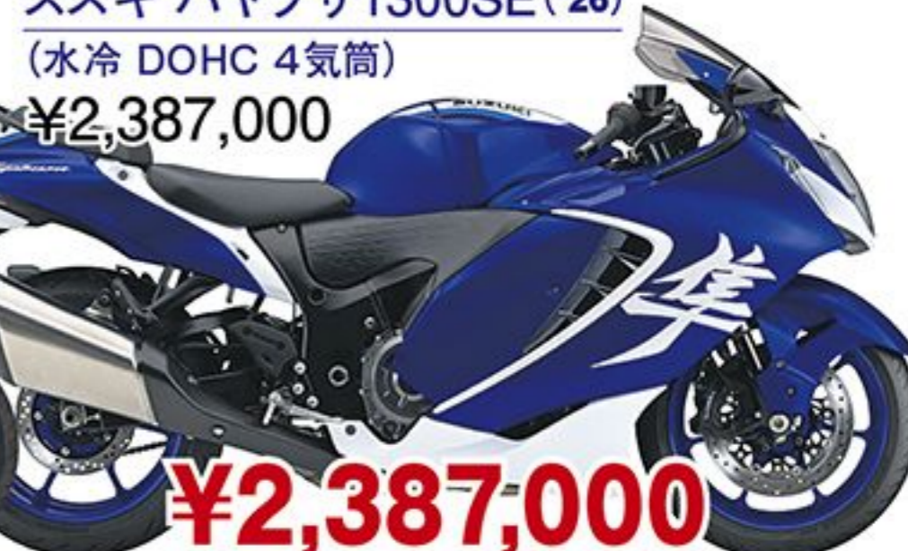
スズキ ハヤブサ1300SE('26) (水冷 DOHC 4気筒) ¥2,387,000