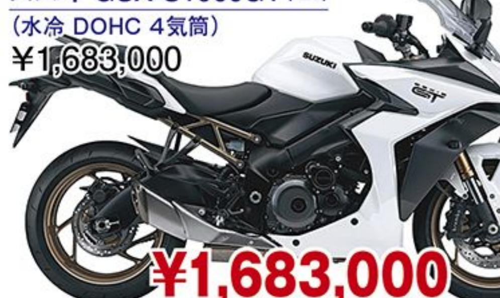
スズキ GSX-S1000GT('26) (水冷 DOHC 4気筒) ¥1,683,000