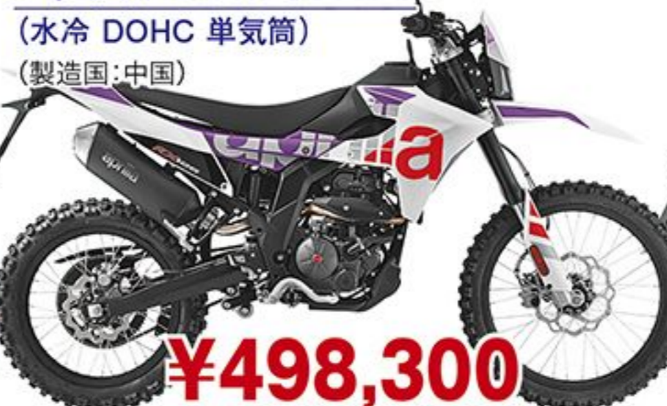
アプリリア RX125('25 JP) (水冷 DOHC 単気筒) (製造国:中国)