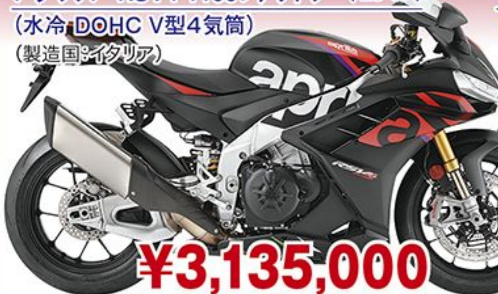
アプリア RSV4 1100ファクトリー('23 JP) (水冷 DOHC V型4気筒) (製造国:イタリア)