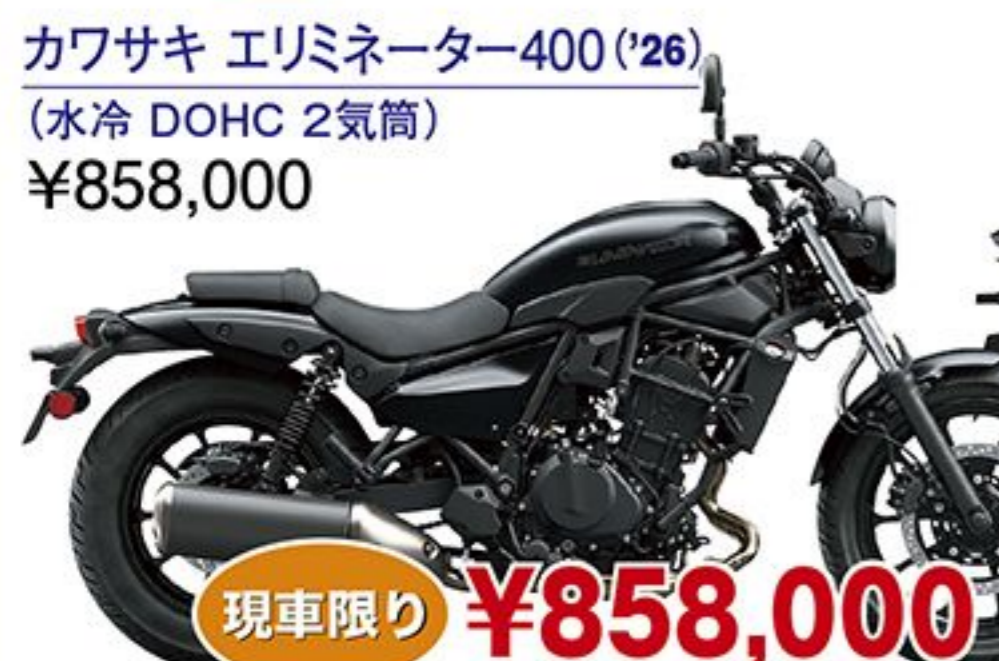
カワサキ エリミネーター400('26) (水冷 DOHC 2気筒) ¥858,000