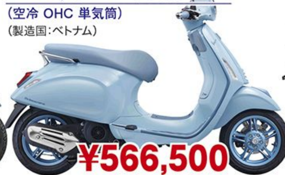
ベスパ プリマベラS150('25 JP) (空冷 OHC 単気筒) (製造国:ベトナム)