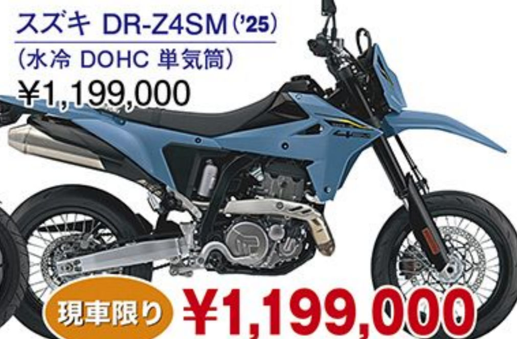
スズキ DR-Z4SM('25) (水冷 DOHC 単気筒) ¥1,199,000