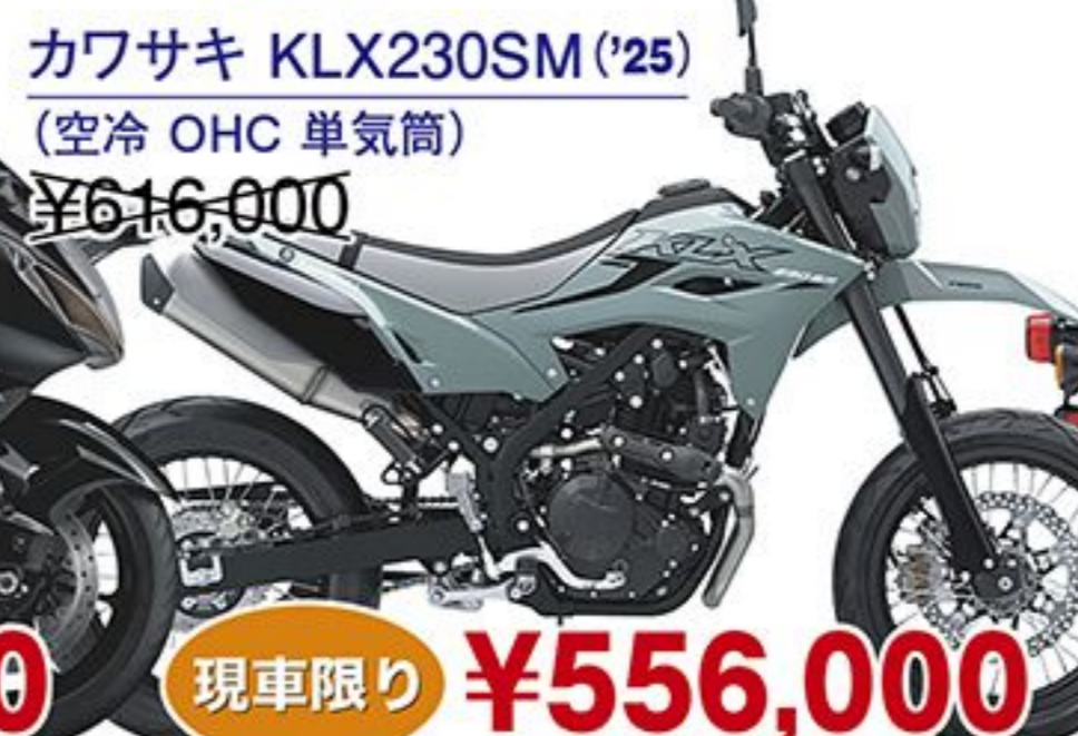
カワサキ KLX230SM('25) (空冷 OHC 単気筒) ¥616,000