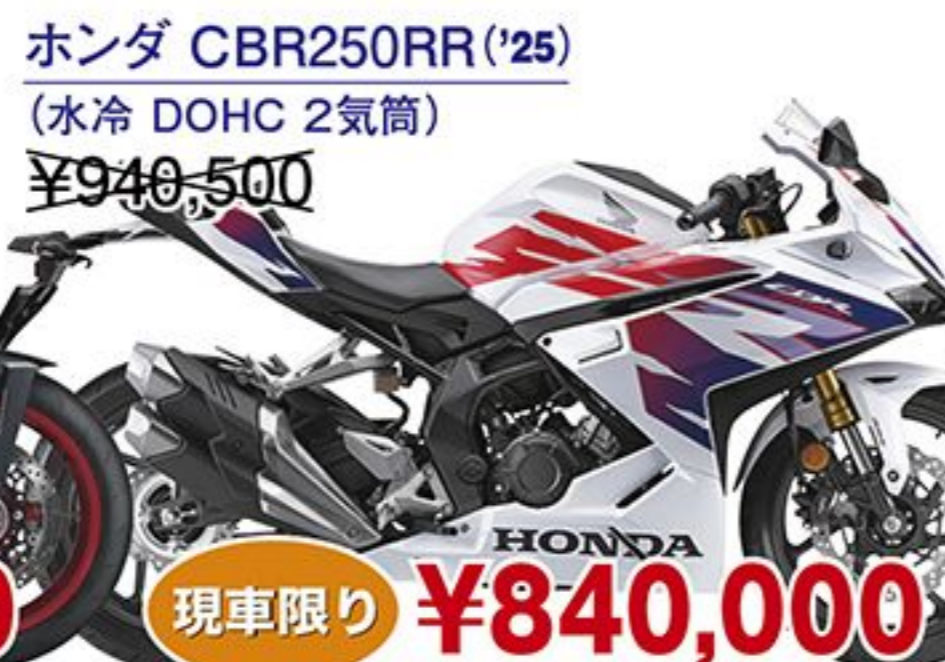
ホンダ CBR250RR('25) (水冷 DOHC 2気筒) ¥940,500