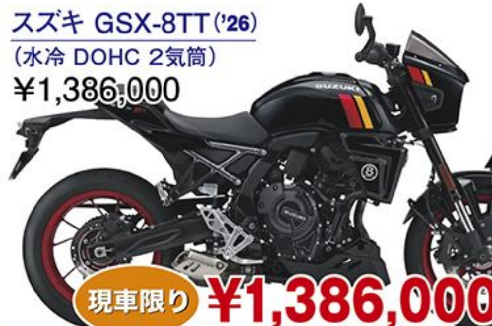
スズキ GSX-8TT('26) (水冷 DOHC 2気筒) ¥1,386,000