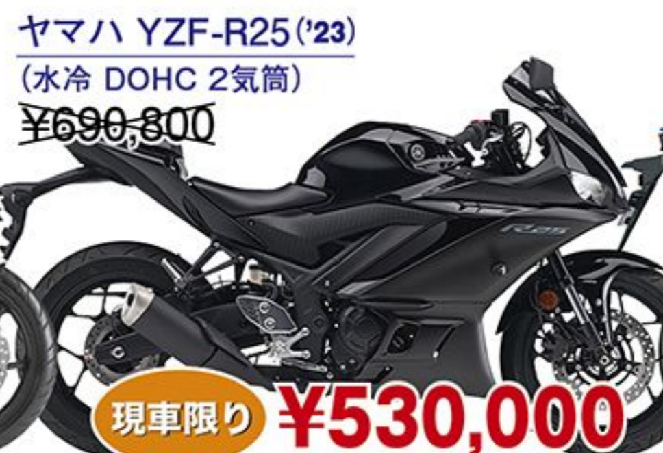
ヤマハ YZF-R25('23) (水冷 DOHC 2気筒) ¥690,800