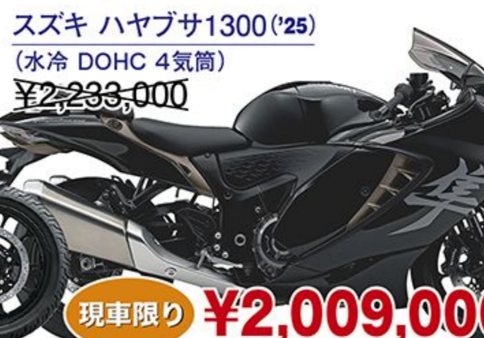
スズキ ハヤブサ1300('25) (水冷 DOHC 4気筒) ¥2,233,000