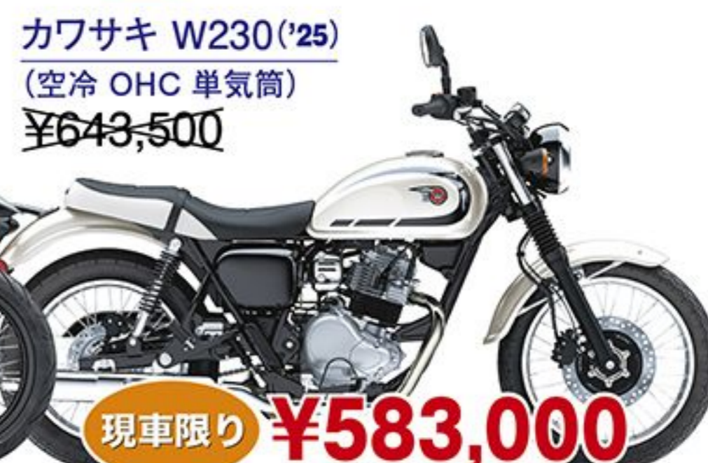
カワサキ W230('25) (空冷 OHC 単気筒) ¥643,500