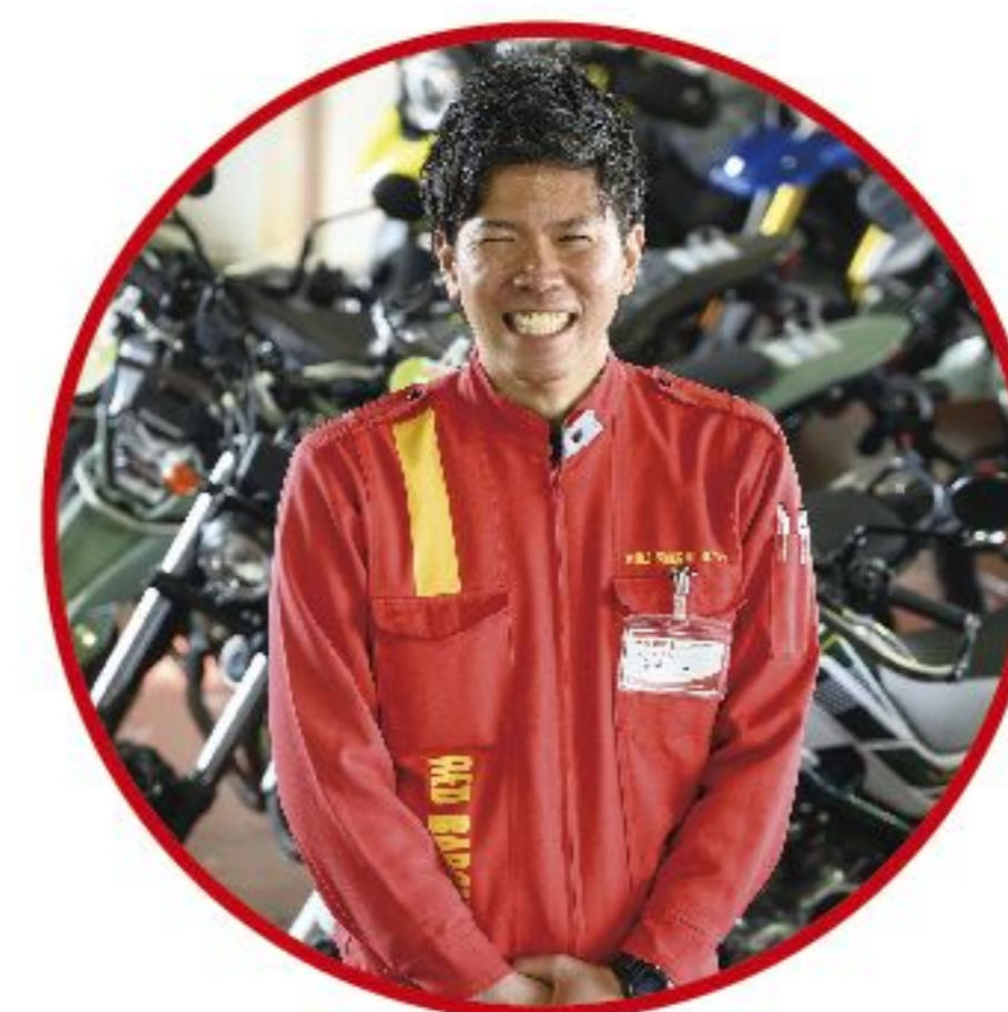
営業職 販売買取スタッフ