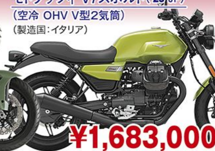
モトグッツィ V7スポルト('25 JP) (空冷 OHV V型2気筒) (製造国:イタリア)