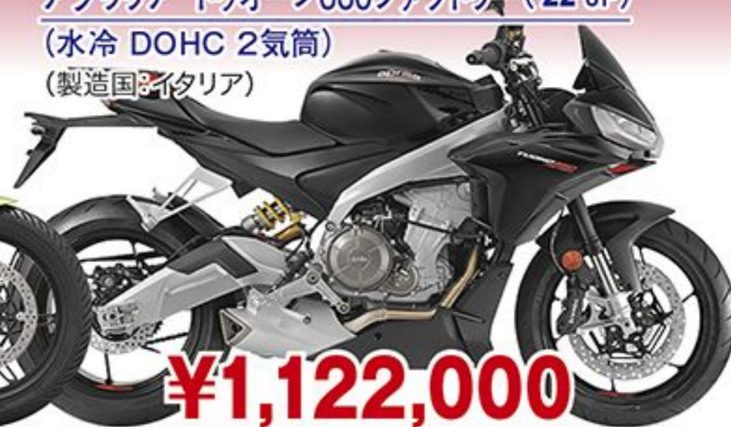
アプリリア トゥオーノ660ファクトリー('22 JP) (水冷 DOHC 2気筒) (製造国:イタリア)