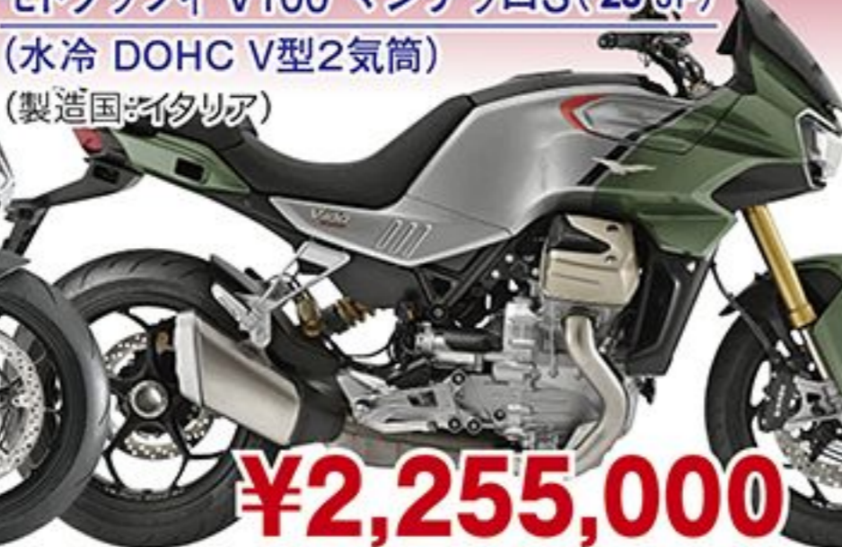
モトグッツィ V100 マンデッロS('23 JP) (水冷 DOHC V型2気筒) (製造国:イタリア)