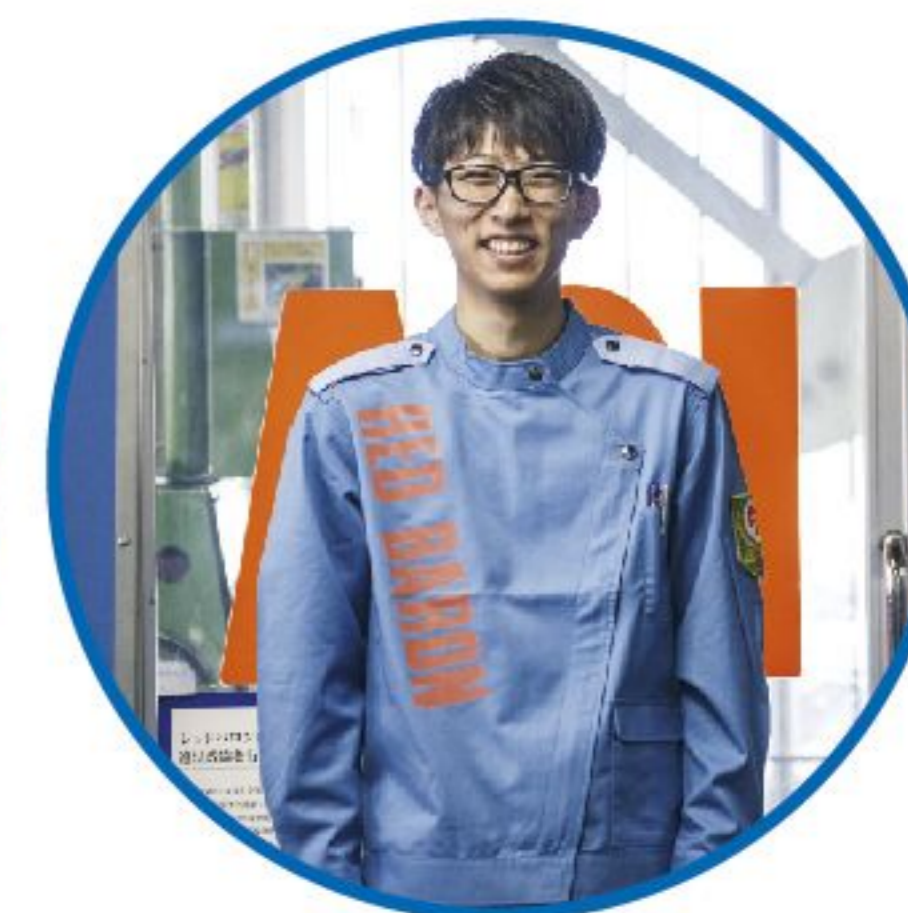
整備職 未経験者歓迎