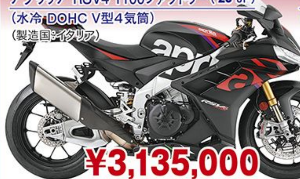
アプリリア RSV4 1100ファクトリー('23 JP) (水冷 DOHC V型4気筒) (製造国:イタリア)