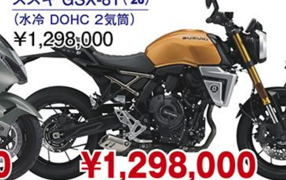
スズキ GSX-8T('26) (水冷 DOHC 2気筒) ¥1,298,000