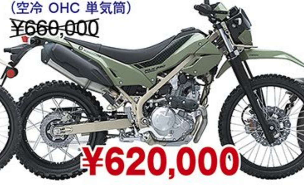
カワサキ KLX230 シェルパS('26) (空冷 OHC 単気筒) ¥660,000