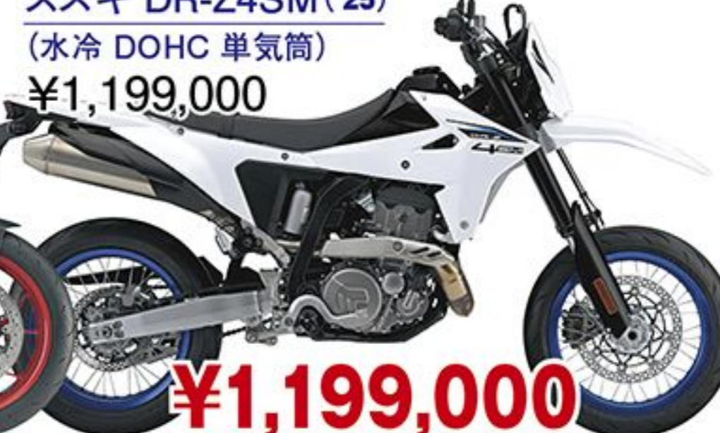
スズキ DR-Z4SM('25) (水冷 DOHC 単気筒) ¥1,199,000