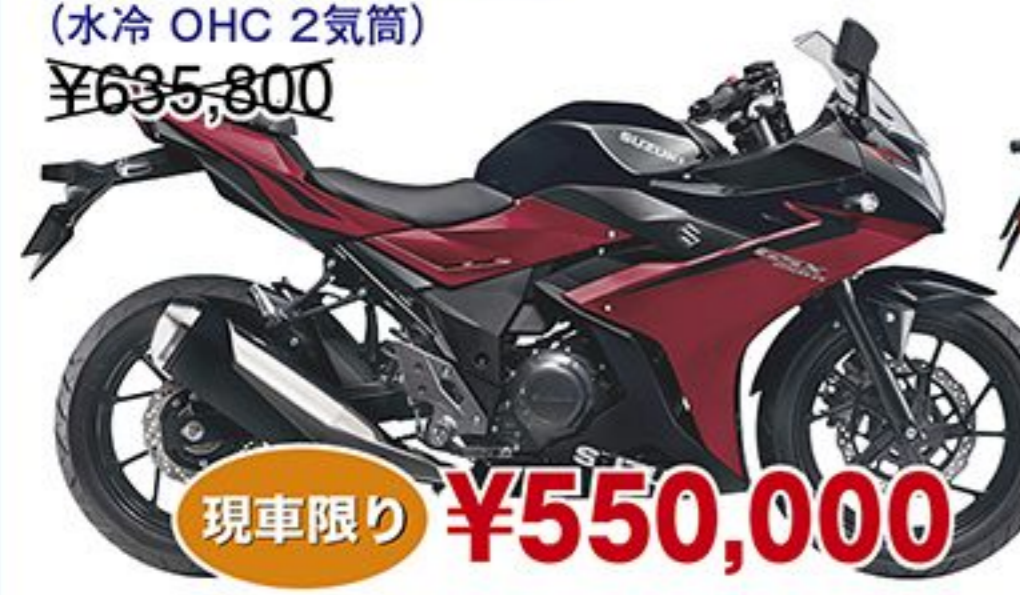
スズキ GSX250R('24) (水冷 OHC 2気筒) ¥635,800