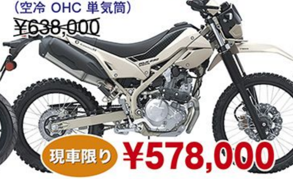
カワサキ KLX230 シェルパ('25) (空冷 OHC 単気筒) ¥638,000