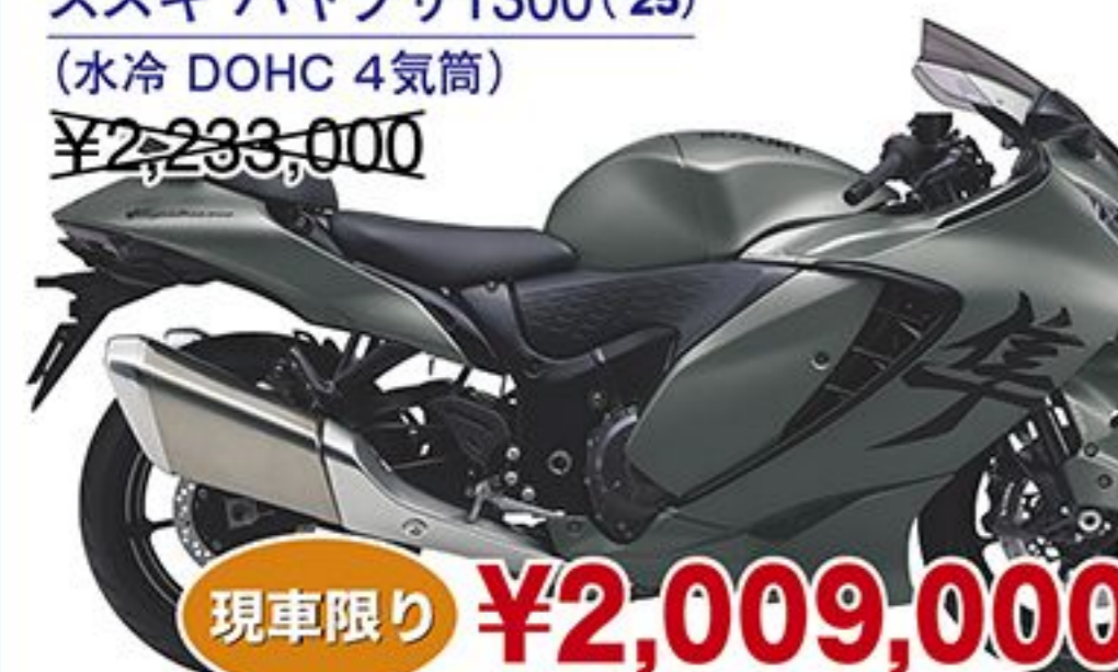
スズキ ハヤブサ1300('25) (水冷 DOHC 4気筒) ¥2,233,000