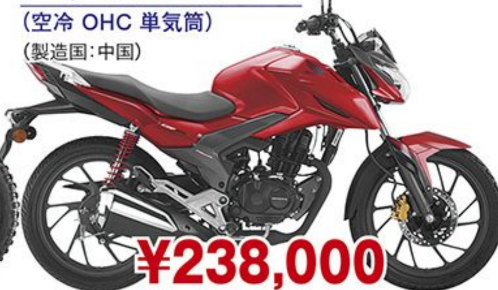
ホンダ CBF125R('19 JP) (空冷 OHC 単気筒) (製造国:中国)