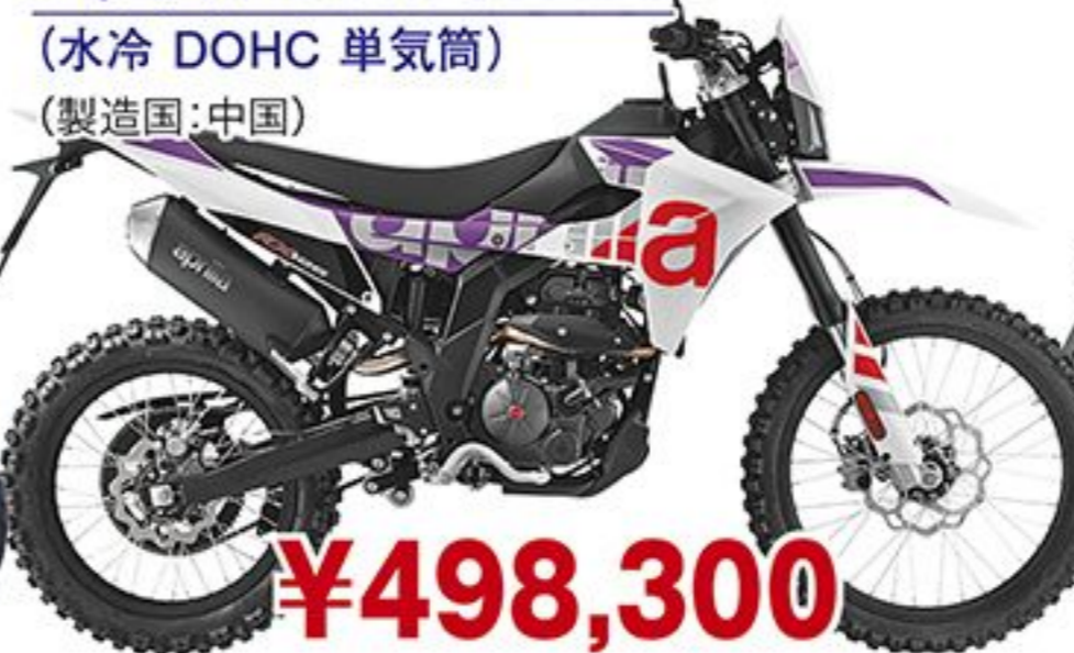
アプリア RX125('25 JP) (水冷 DOHC 単気筒) (製造国:中国)