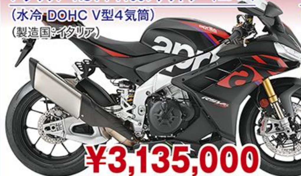
アプリア RSV4 1100ファクトリー('23 JP) (水冷 DOHC V型4気筒) (製造国:イタリア)