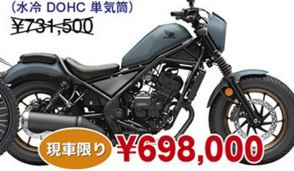
ホンダレブル250 S1ディジョン Eクラッチ('25) (水冷 DOHC 単気筒) ¥731,500