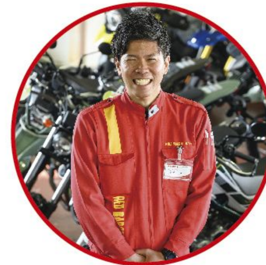
営業職 販売買取スタッフ