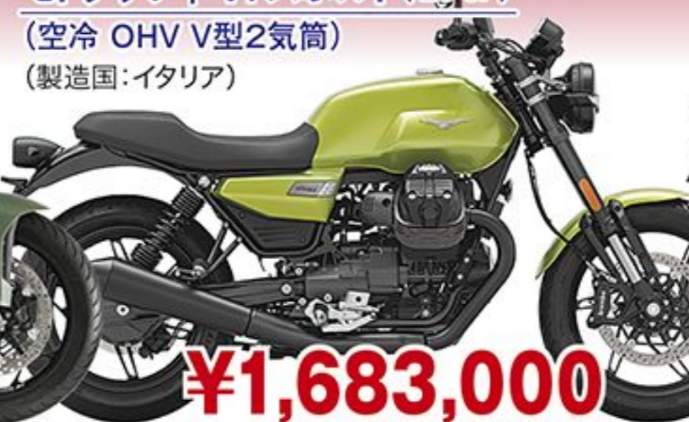
モトグッツィ V7スポーツ('25 JP) (空冷 OHV V型2気筒) (製造国:イタリア)