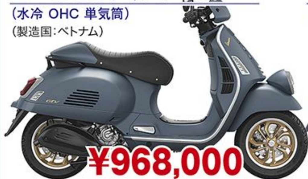
ベスパ GTV300 オフィチーナ オット('25 JP) (水冷 OHC 単気筒) (製造国:ベトナム)