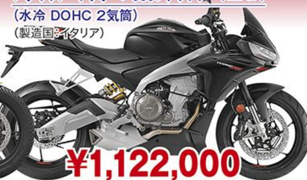
アプリア トゥオーノ660ファクトリー('22 JP) (水冷 DOHC 2気筒) (製造国:イタリア)