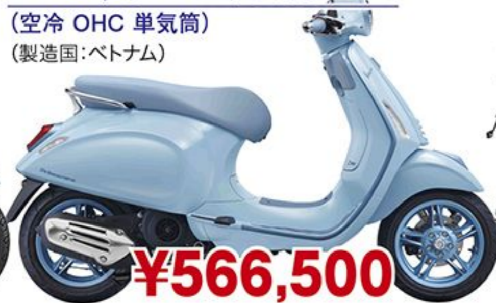
ベスパ プリマベラS150('25 JP) (空冷 OHC 単気筒) (製造国:ベトナム)