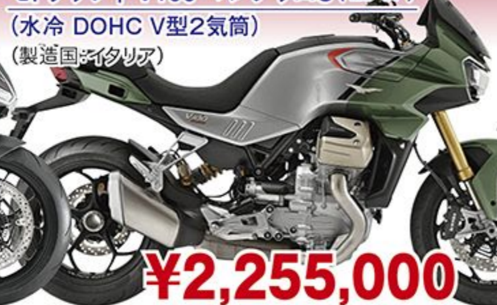
モトグッツィ V100 マンデッロS('23 JP) (水冷 DOHC V型2気筒) (製造国:イタリア)