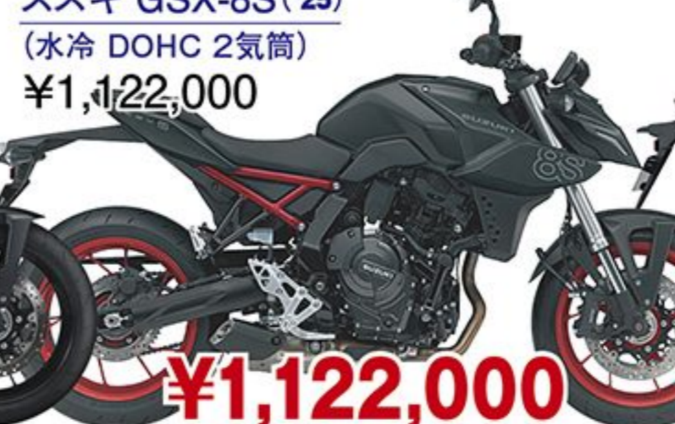
スズキ GSX-8S('25) (水冷 DOHC 2気筒) ¥1,122,000